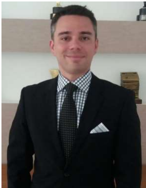
Saul Tourinho Leal

No Brasil, a advocacia perante o Supremo Tribunal Federal e o Superior Tribunal de Justiça tem passado pelo grande desafio da reinvenção. Não é exagero dizer que, cada vez mais, as partes terão seus casos examinados por essas duas Cortes Supremas de modo semelhante ao dos artistas aspirantes ao Carnegie Hall.