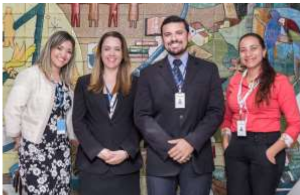
Gerência Sindical da CNCoop

Comentário: "Dentre as mudanças trazidas pela MP nº. 808/2017, de efeitos imediatos, constam a forma de estipulação da jornada de 12 horas por 36 horas, o detalhamento da modalidade de contratação de trabalho intermitente e de trabalho autônomo e o enquadramento do grau de insalubridade e prorrogação de jornada de trabalho em condições insalubres nas negociações coletivas de trabalho. O Sistema OCB continuará acompanhando o trâmite da MP nº. 808/2017 perante o Congresso Nacional, que terá até 120 (cento e vinte) dias para aprovar, mudar ou rejeitar os ajustes promovidos pelo governo.